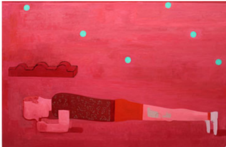
"Plankan I" © Ragnar Schmid