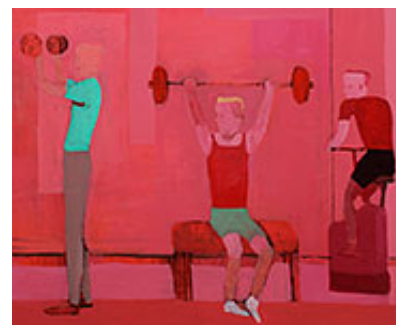
"Skivstång II" (detalj) © Ragnar Schmid